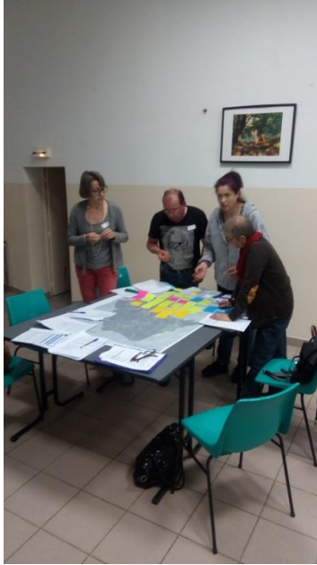
Table 1 - travail sur les enjeux et hiérarchisation