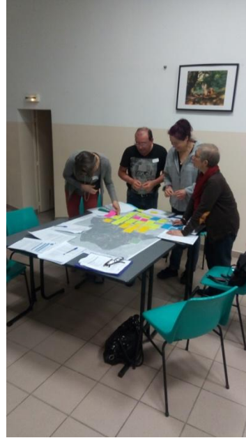
Table 2 - travail sur les enjeux et hiérarchisation